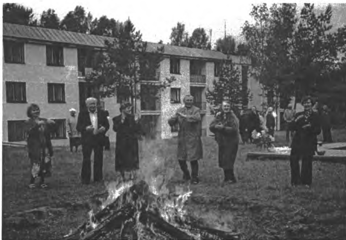
Tremtinių namų gyventojai prie partizanų laužo

Nepatyrę jaunystėje daug džiaugsmo ir laimės "Tremtinių namų" gyventojai čia džiaugiasi ramia senatve.