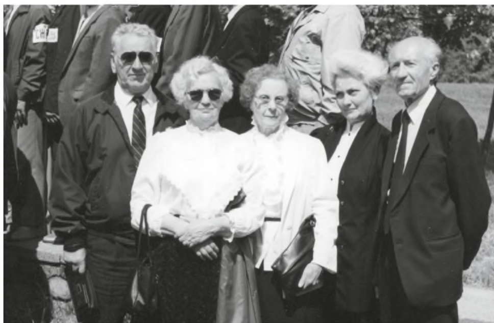
Balchašiečių suvažiavime 1996 metais

O Staselė dar ir šiandien jaučia, kaip prieš pusę amžiaus, išlipusi Vilniuje, pratrūko visa siela: „O Lietuva, taip kvėpia! Taip kvėpia...“