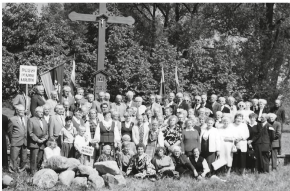
VI forte prie kryžiaus Balchašo tremtiniams 1996 metais