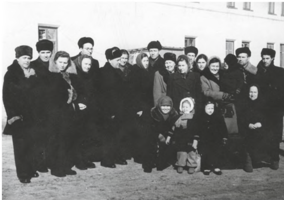
Prieš išvažiuojant į Lietuvą