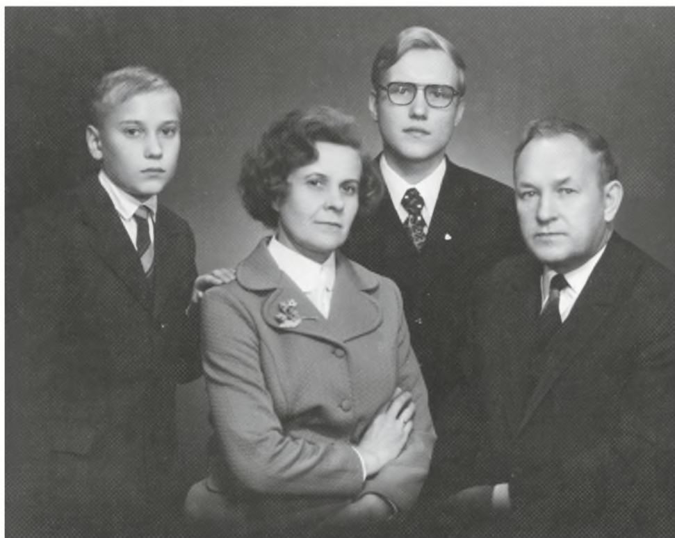
Ausmanų šeima 1973 metais